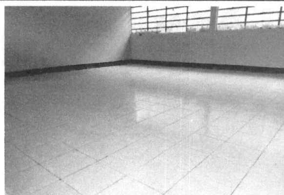
Foto 2: Área finalizada donde se realizó el mejoramiento de piso e instalación de tipo cerámico.