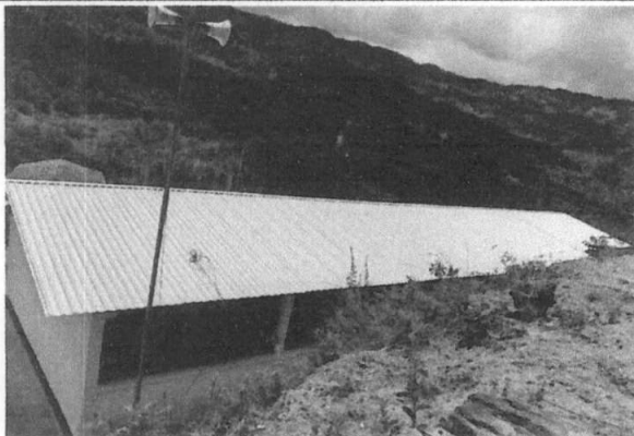
Foto 1: Área finalizada donde se realizó el mejoramiento para la cubierta de lámina.