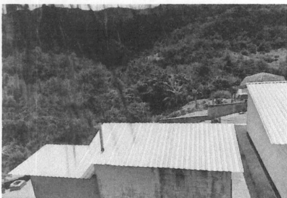
Foto 3: Área finalizada donde se realizó el mejoramiento e instalación de cubierta de lámina en los servicios sanitarios.